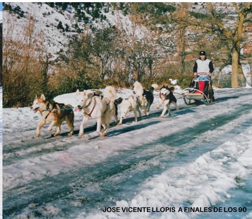
JOSE VICENTE LLOPIS A FINALES DE LOS 90